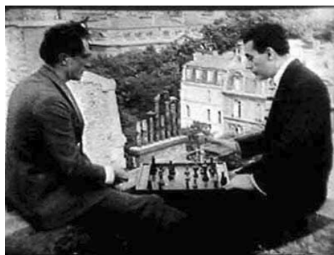
Figura 1: Duchamp e Man Ray em Entr'acte de René Clair

Célebre artista de vanguarda, Marcel Duchamp também era um exímio jogador de xadrez, e pelas suas próprias palavras podemos verificar seu modo pessoal de relacionar a atividade artística com a de um jogador: “What is art? That little game that men have always played with one another.” (Pearce, 2)